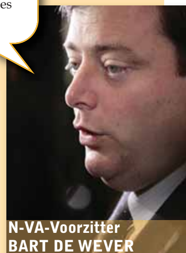
N-VA-Voorzitter BART DE WEVER