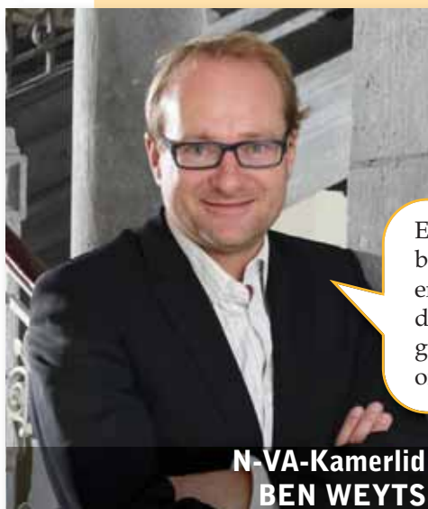
N-VA-Kamerlid BEN WEYTS

Elke dag worden er in de federale regering beslissingen genomen over budget, migratie, energie of justitie die aan Vlaamse kant slechts door een minderheid (CD&V en Open Vld) gesteund worden. Die beslissingen komen er onder druk van Di Rupo, Milquet en Reynders.