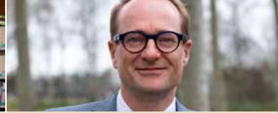
Ben Weyts opnieuw Vlaams minister (p. 3)