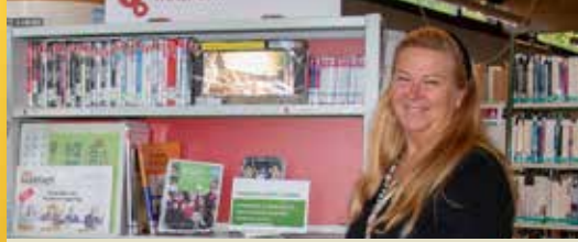
Taalpunt Bib Beersel in de kijker (p. 2)